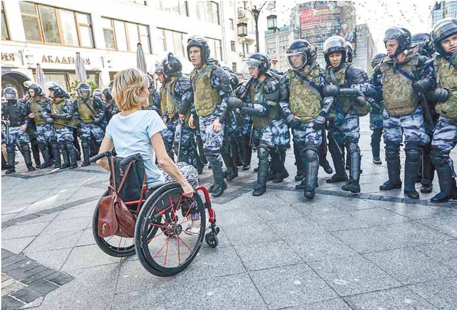
Москва, 27 июля 2019 года.

субботний московский протест разошёлся по Москве. Разгулялся.