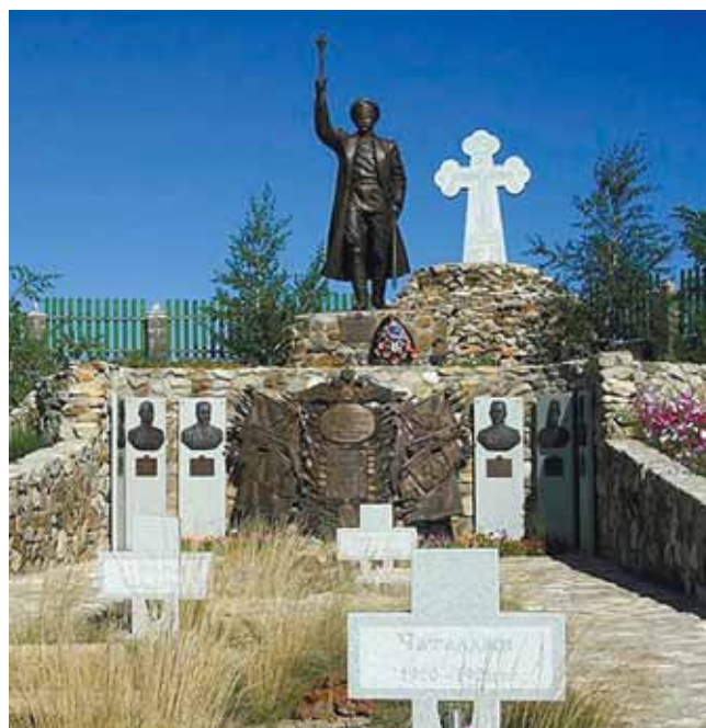
Памятник Петру Краснову в Ростовской области.