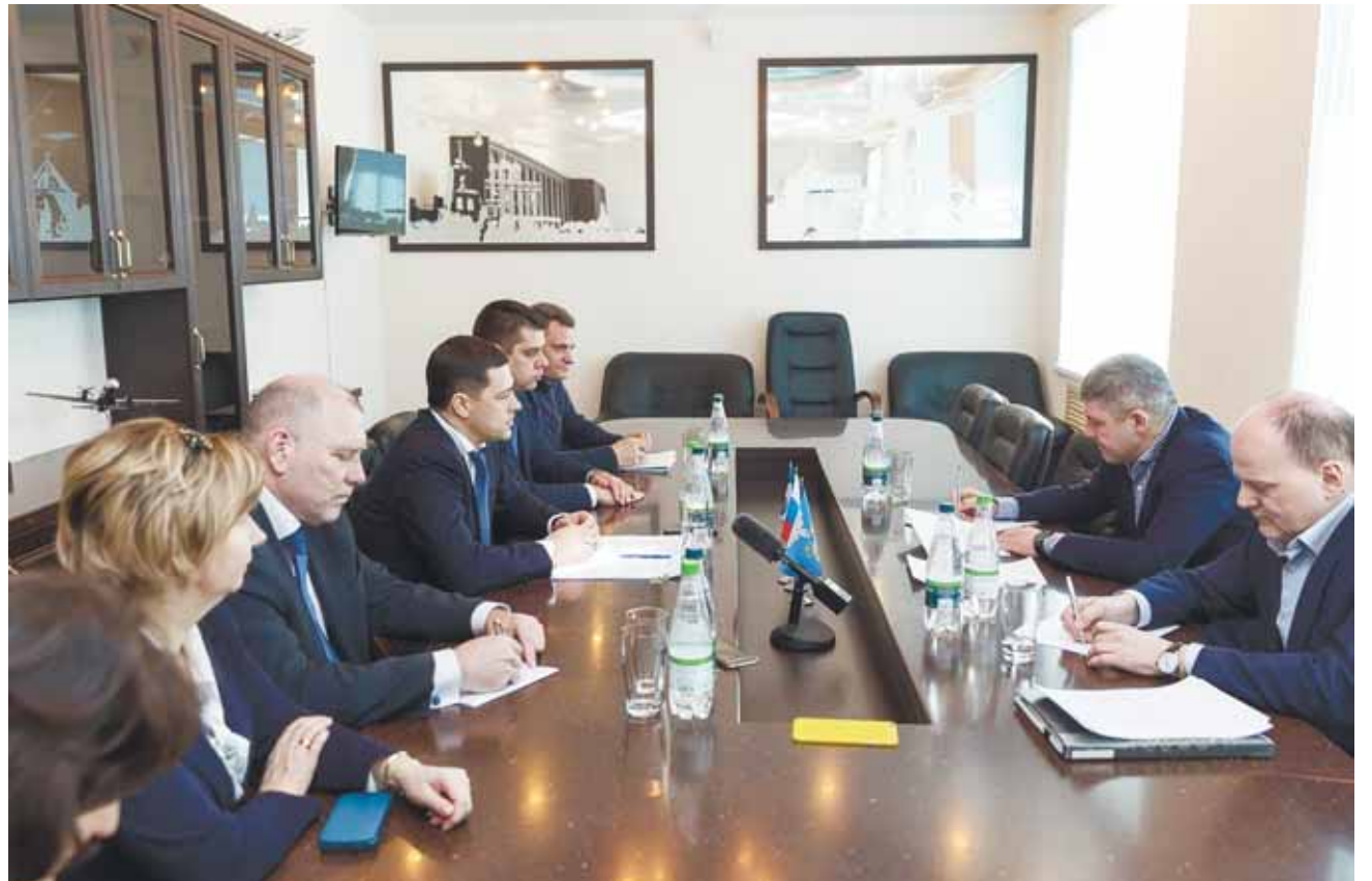
Встреча администрации Псковской области с главой ГК «Евросиб» Дмитрием Никитиным (дальний справа). Апрель 2018 года.