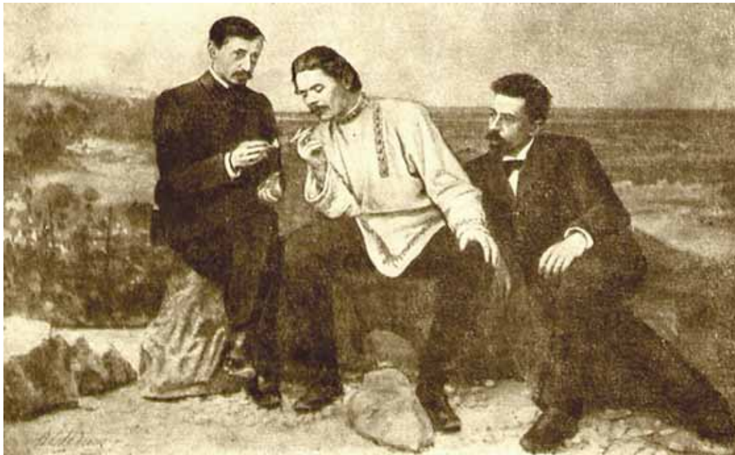
Бунин и Горький.