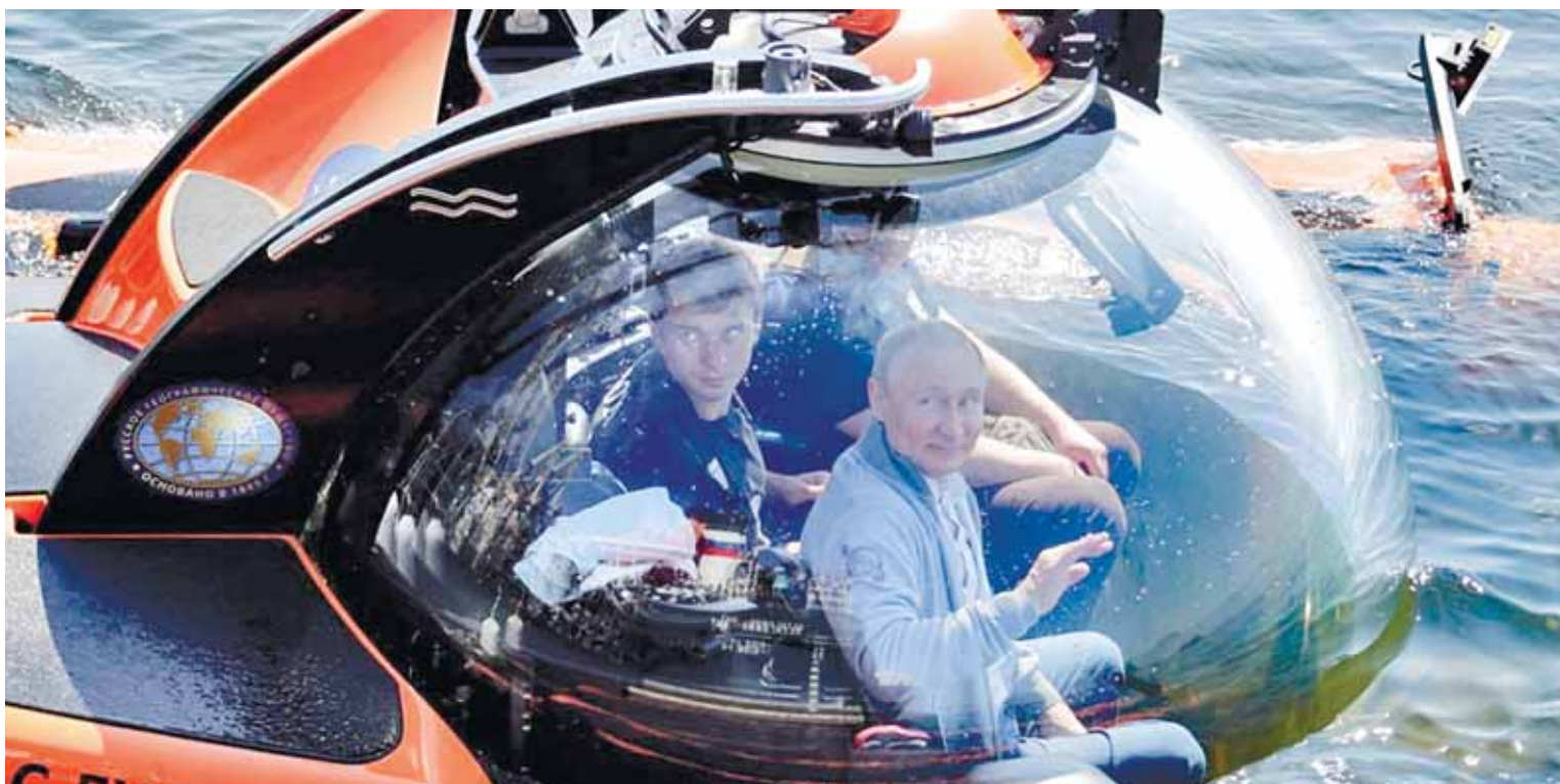
Владимир Путин во время погружения на дно Финского залива, 27 июля 2019 года.

Те, кто выдавливал безоружный народ с Тверской или не пускал туда, создали себе проблему. Протестующие оказались в относительно узком пространстве примыкающих к Тверской переулков. Там их было сложнее окружать. Таким образом,